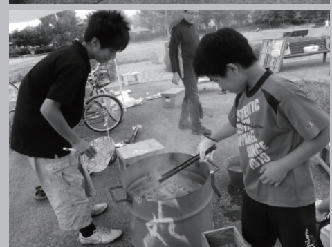
上：ロープ遊具を手作り 中上：公園のタイルを利用したすごろく 中下：木工で色々なものがつくれます 下：火おこしに挑戦