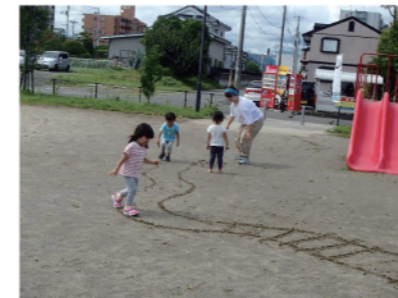
ながいなかい輪道を作りました

10月の乳幼児親子対象の「まま and ばばかほえ」は5日と19日の午前中です。誰でも参加できます。この日だけは公園内で七輪での火を許可してもらっています。マシュマロを焼いて食べたり持ってきたおにぎりを焼いて食べたりもできます。乳幼児のお父さんお母さん、遊びに来てね。